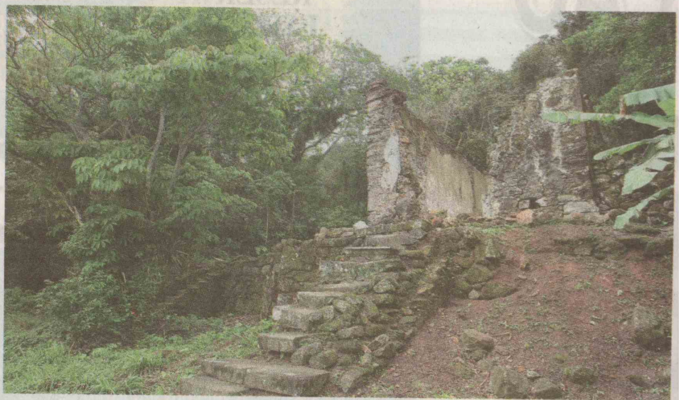
Um dos presentes do passeio é a ruína da Ermida de Santo Antônio do Guaibê, nas encostas da serra