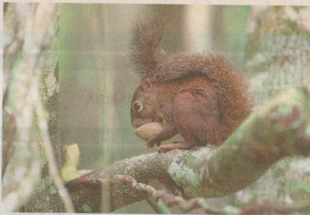
Com sorte é possível ver esquilo buscando alimentação na mata

Praia Preta, pontos turísticos que abrigam pescadores.